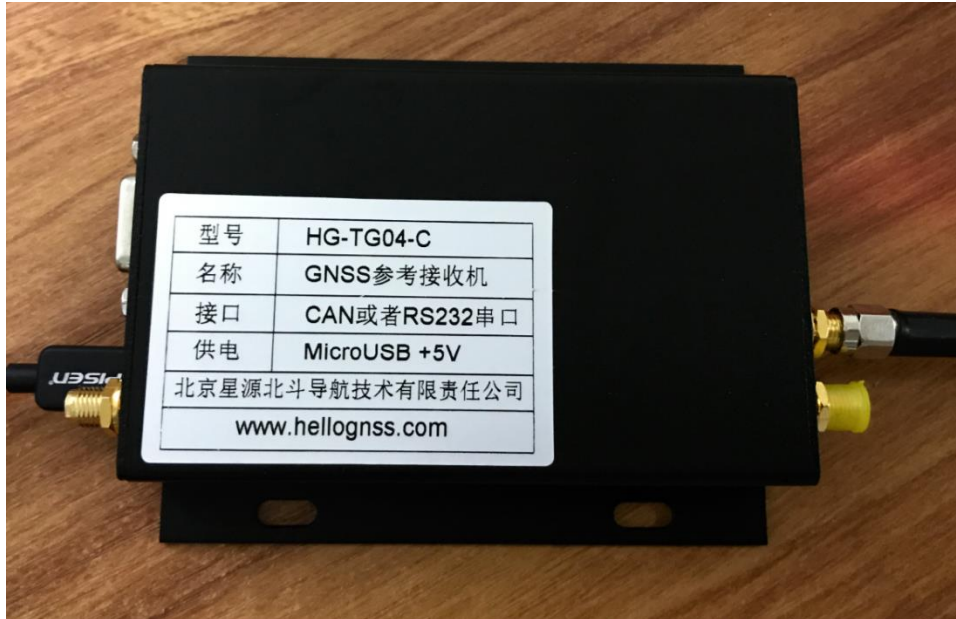
图 5 HG-TG04-C 参考接收机 (HG-TG04-D 外观相同)

HG-TG04-C/D 参考接收机用于给模拟器提供原始导航电文，这种导航电文是基本没有损失的真实导航电文。HG-TG04-C/D 可通过 CAN 或者 RS232 串口输出导航电文。