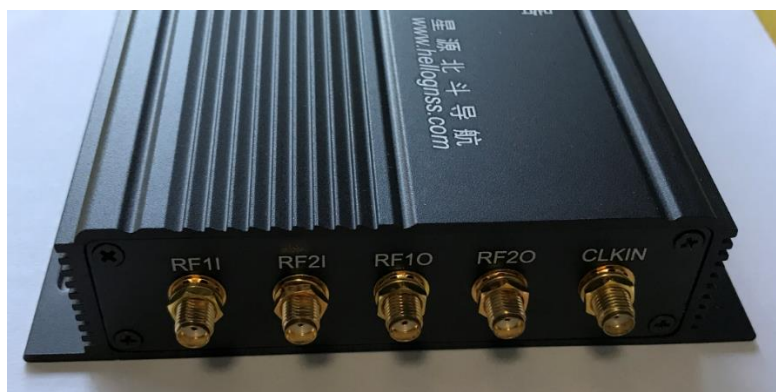
图 3 HG-RFSIM4-M 后面板