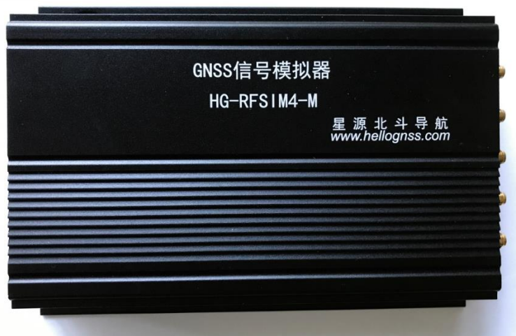
图 1 HG-RFSIM4-M 信号模拟器硬件