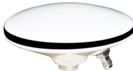
图 6 HG-ANT3 全频点天线

HG-TG04-C/D 配套的天线是 HG-ANT03 全频点天线，HG-ANT03 是一款集 BD B1、B2、B3；GPS L1、L2、L5；GLONASS L1、L2、L3；Galileo E1/E2/E5a/E5b 的三星全频外置测量型天线，可广泛应用于大地测量、桥梁施工、海洋测量、水下地形测量、基站等场合。该天线采用多馈点设计，保证天线相位中心和几何中心的重合，提高测量的精度。内置低噪声放大模块，采用前置及多级滤波器滤除干扰信号，保证在恶劣电磁环境下正常工作。