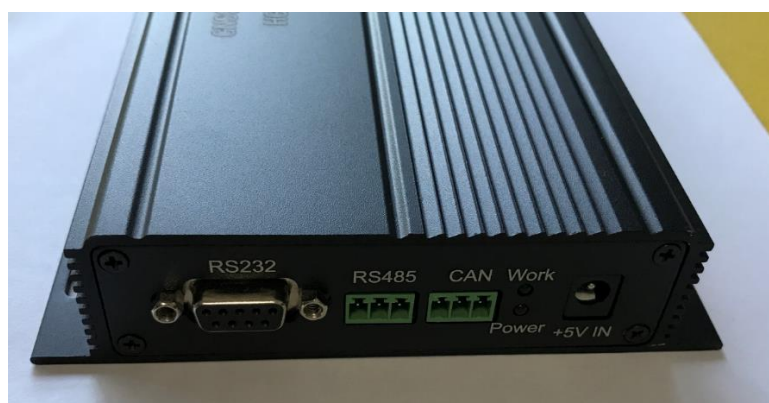
图 2 HG-RFSIM4-M 前面板